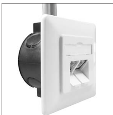
Einbau im Unterputzbecher.