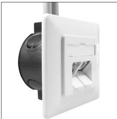
Installation to in-wall cup.