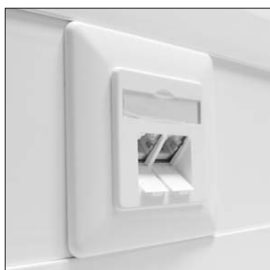
Einbau im Brüstungskanal.